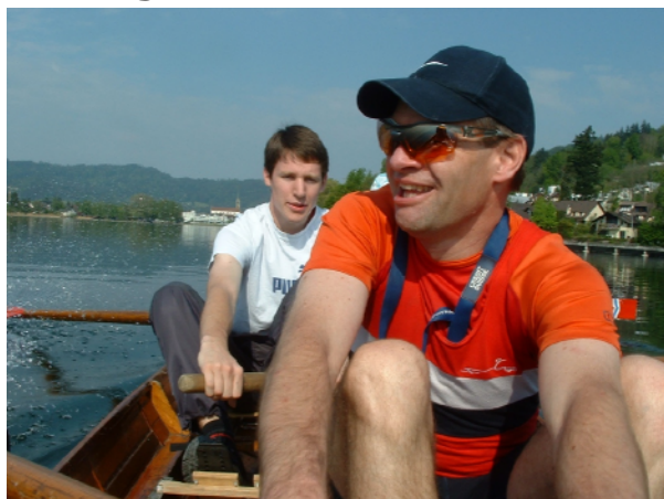
Anrudern im über 80jährigen Holzboot "Mohr"