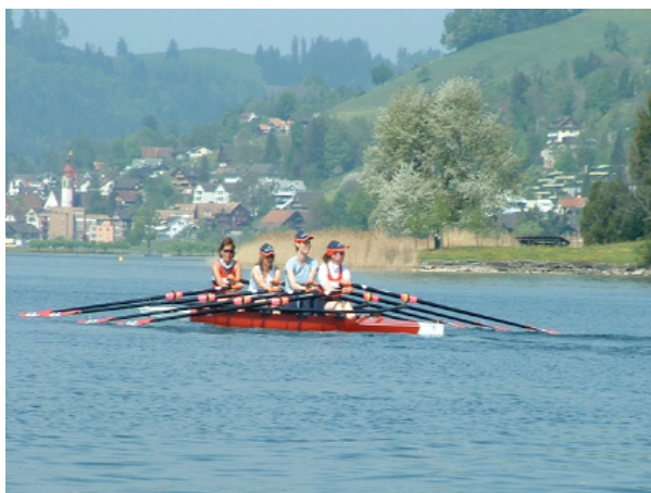
Frauen-Vierer – die "Poseidon" vor Oberägeri