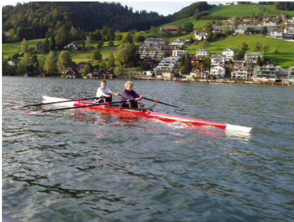
Junioren-Doppelzweier beim Auslaufen in Oberägeri