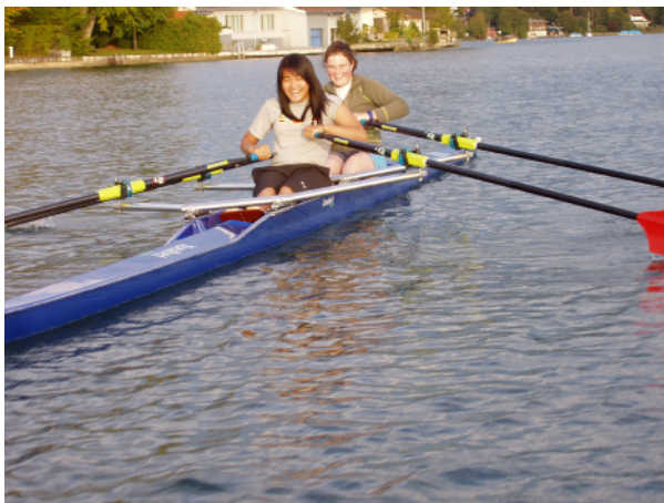
Auch junge Frauen entdecken das Rudern im Doppelzweier in Unterägeri