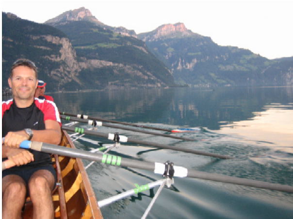
Traumhafte Verhältnisse auf dem Vierwaldstättersee