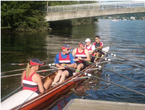
Der Doppelvierer "Bratworscht" legt in Luzern ab