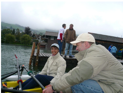
Schnupper-Rudern für Interessierte