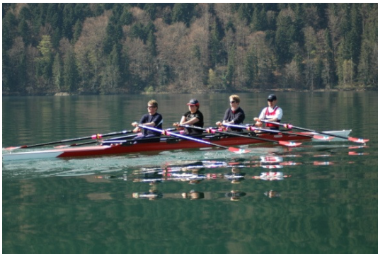
Doppelvierer vor dem Bergwald