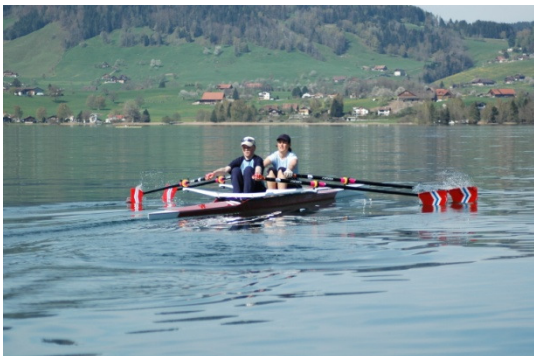
Eine gute Blatтарbeit ist entscheidend