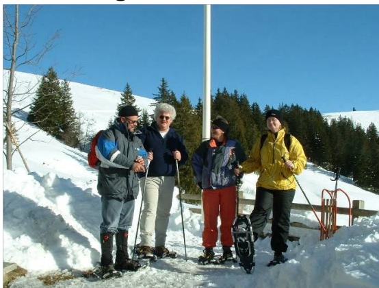
Mit Schneeschuhen unterwegs